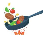
Aus der Pfanne“

Alle Gerichte jeweils auch in einer vegetarischen Variante erhältlich. Unverträglichkeiten / Allergien bitte per Mail an info@avusa.ch melden.